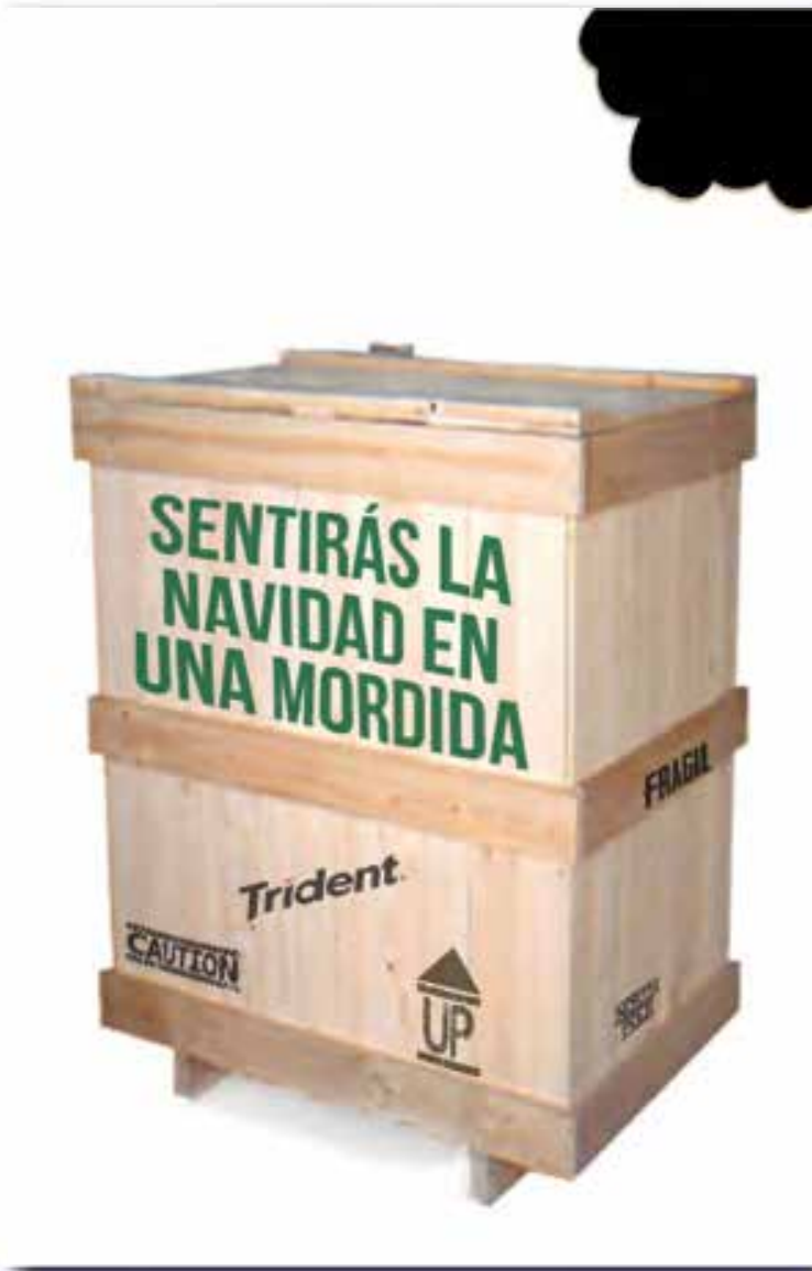
Pieza Publicitaria de Expectación