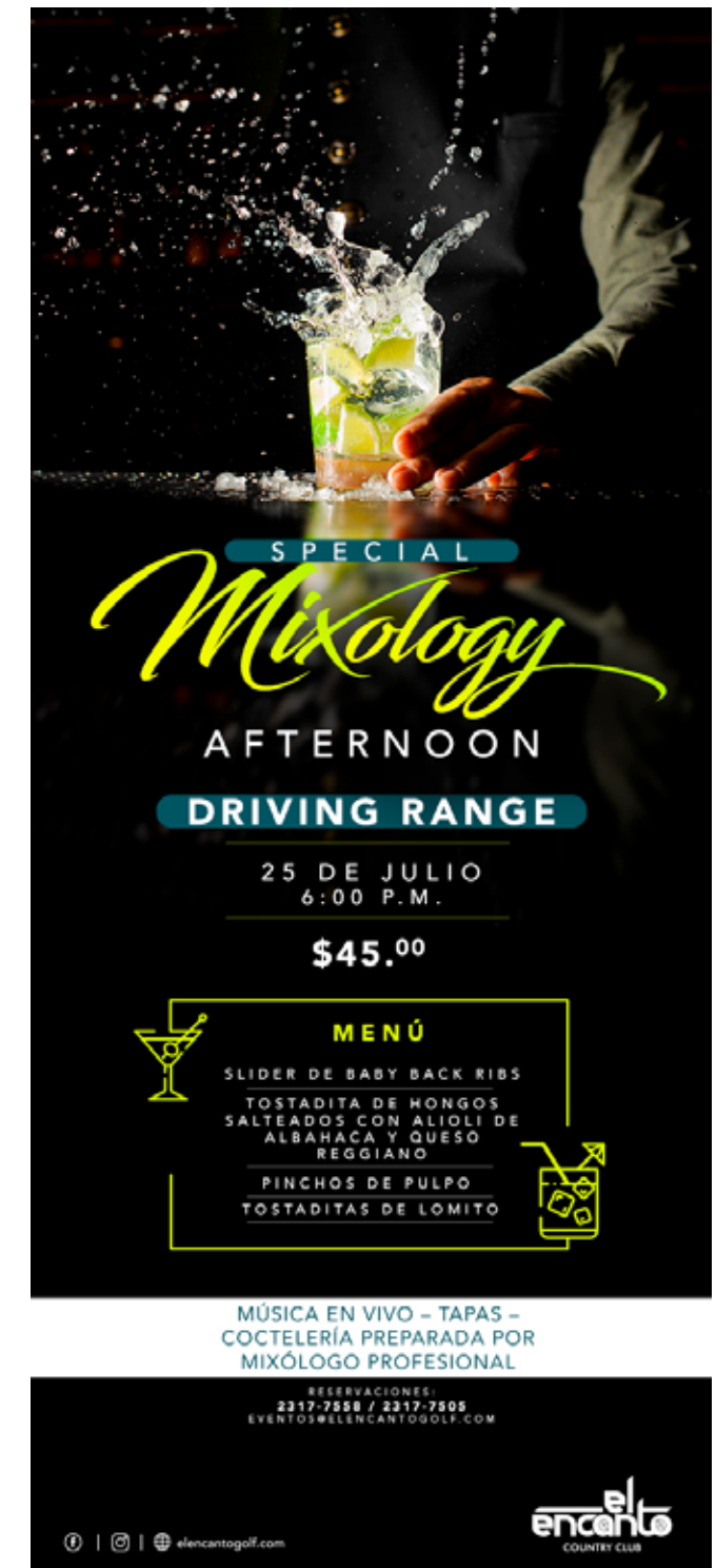
Diseño publicitario para envío masivo