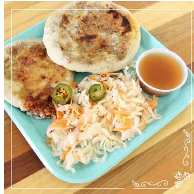
Pieza Publicitarias para redes sociales