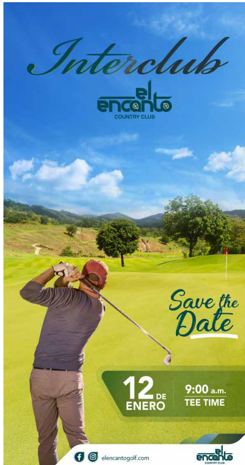
Edición fotográfica y diseño publicitario para torneo de Golf