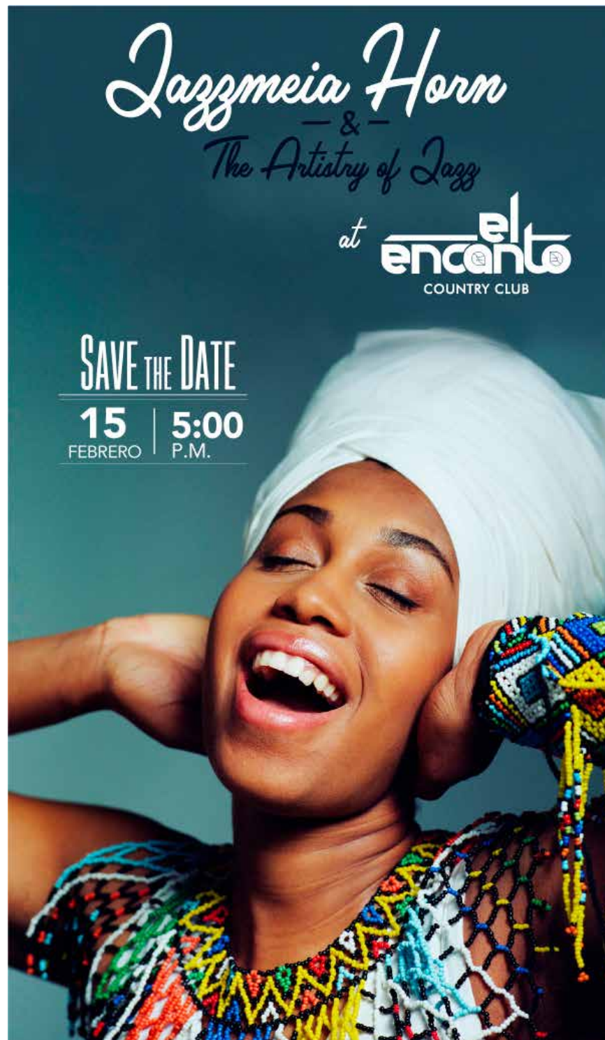
Diseño publicitario para evento de jazz con invitada internacional